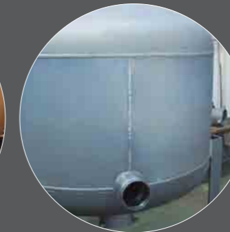
Nanotecnología Nanotechnology Nanotechnologie