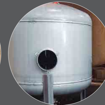
Decapado Acid pickling Décapage