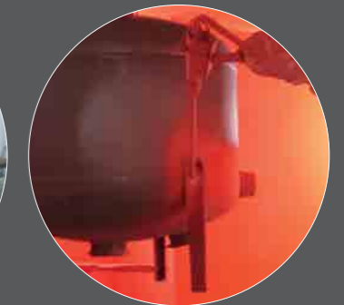
Pintura epoxy poliéster Powder epoxy painting Peinture en poudre d'époxy