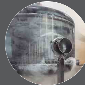
Acero al carbón Carbon steel Acier au carbon